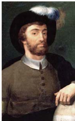
JUAN SEBASTIÁN ELCANO

Partió como maestro en la nao Concepción, pero la figura de Elcano adquirió protagonismo tras la muerte de Magallanes en la isla de Mactán. Fueron sus dotes de buen navegante, como maestro primero y luego como capitán de la nao Victoria, las que lograron que ésta y la Trinidad llegaran a las islas Molucas. Y ya con la nao Victoria como única embarcación operativa de la expedición, fue Elcano quien la llevó con éxito hacia el cabo de Buena Esperanza, pasando por Cabo Verde, para llegar por fin a España en septiembre de 1522.