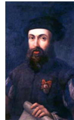
FERNANDO DE MAGALLANES

Entre ellas se encontraba el hombre que conseguiría completar la hazaña: Juan Sebastián Elcano.